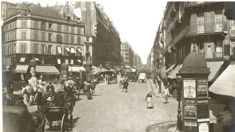
Archives des rues de Paris au XIXe.

Le XIX est ainsi caractérisé par la révolution industrielle, le progrès de la science, ou encore les changements de Paris.